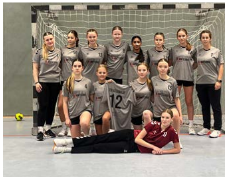
Danke an die Firma Apparius Dämmtechnik und die Firma Nadelholz für unsere Auswärtstrikots