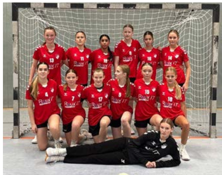
Danke an die Firma Roux-IT für unsere Heimtrikots

Nach einer längeren Spielpause empfangen wir zuletzt die HSG Schwanewede/Neuenkirchen II. In dieser Partie gelang es uns, viele Trainingsinhalte erfolgreich umzusetzen, und wir feierten einen klaren 33:15-Heimsieg.